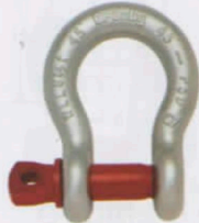
G-209 / S-209

G-209 Los grilletes tipo ancla con perno roscado cumplen con la Especificación Federal RR-C-271F Tipo IVA, Grado A, Clase 2, excepto por las estipulaciones exigidas del contratista. Para mayores informaciones vea la página 444.