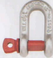
G-210 / S-210

G-210 Los grilletes de perno roscado para cadena cumplen la Especificación Federal RR-C-271F, Tipo IVB, Grado A, Clase 2, excepto por las estipulaciones exigidas del contratista. Para mayores informaciones vea la página 444.