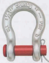
G-213 / S-213

Los grilletes tipo ancla con perno roscado cumplen con la Especificación Federal RR-C-271F, Tipo IVA, Grado A, Clase 2, excepto por las estipulaciones exigidas del contratista. Para mayores informaciones ver página 444.