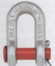
G-215 / S-215

G-215 Los grilletes de perno recto para cadena cumplen la Especificación Federal RR-C-271F, Tipo IVB, Grado A, Clase 1, excepto por las estipulaciones exigidas del contratista. Para mayores informaciones ver página 444.